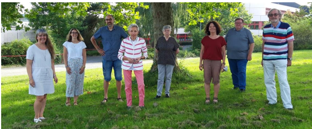
Der aktuelle Vorstand stellt sich vor.