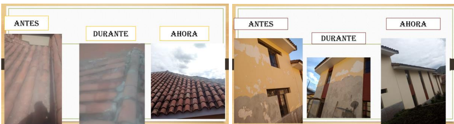
Bilder von den Renovierungen der Dächer und der Fassaden. Vorher – während - jetzt.