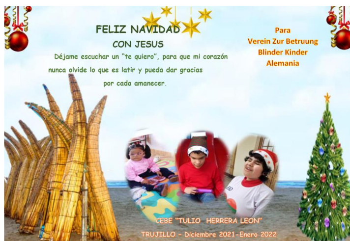
Weihnachtskarte aus Trujillo

Übersetzung der Karte: „Lass mich ein „Ich liebe dich“ hören, damit mein Herz nie vergisst, was es heißt zu schlagen und ich für jeden Sonnenaufgang dankbar sein kann.“