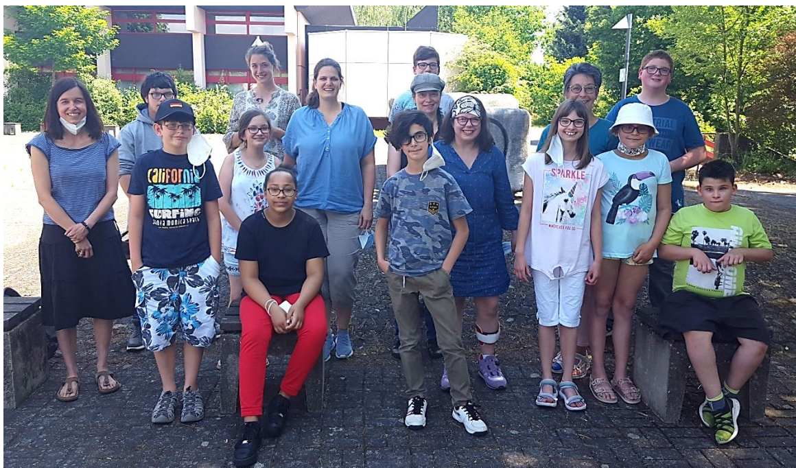
Gruppenfoto der Projektgruppe „Wörterwelten“

des Projektes war die Präsentationsveranstaltung, in der die Schüler*innen ihr Buch vorstellten. Wer das Buch gerne lesen möchte, kann es entweder in der Schülerbibliothek ausleihen oder überall da kaufen, wo es Bücher gibt. „Was bin ich, wenn alle anders sind?“, Mitteldeutscher Verlag, ISBN 978-3-96311-530-1