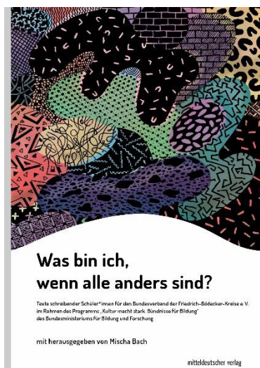
Titelbild des fertigen Buches