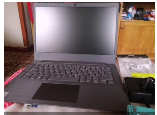
Auch der gewünschte Laptop ist da.

Für den laufenden Unterhalt der Einrichtung im Jahre 2021 haben wir wiederum die notwendigen Mittel zur Verfügung gestellt. Damit wurden u. a. auch Reparaturarbeiten (insbesondere an der Kanalisation) ausgeführt und der Kauf eines Laptops ermöglicht, mit dem die Kommunikation erleichtert werden kann.