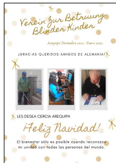
Weihnachtskarte der CERCIA

Wir haben der Bitte entsprochen und das restliche Geld für diesen Zweck freigegeben.