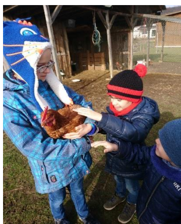
Das fühlt sich richtig weich an.

In diesem Jahr fand der Schülerkurs der Abteilung Beratung & Unterstützung außerhalb des Geländes der Landesschule statt.