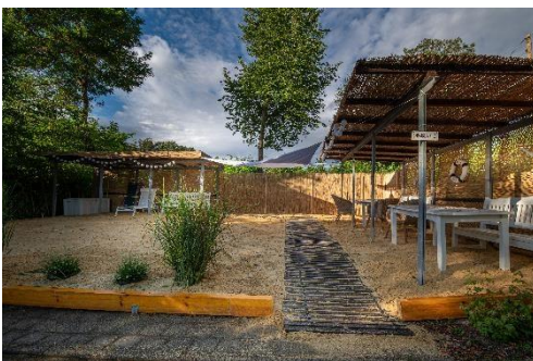
Das neue Außengelände mit Strand,

Der Sommer stand dann ganz im Zeichen davon, den Bewohner*innen Oasen zu schaffen, die an Urlaub erinnern, denn dieser war ja dieses Jahr nicht möglich. Ein Strand, eine Outdoor-Küche und der neu gestaltete Zauberwald haben hier für große Freude unter unseren Klienten gesorgt.