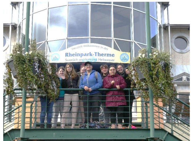
...muss Frau sich ausgiebig erholen.

Für die Entlassschülerinnen war das noch einmal ein ganz besonderes Erlebnis.