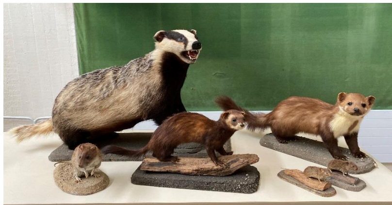
Die neuen Vierbeiner sind in die Biologiesammlung eingezogen.

Die Mitarbeiter*innen hatten viele Wünsche zur Anschaffung von neuen Materialien.