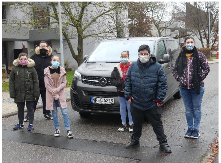
Leider kann das tolle neue Auto noch nicht oft genutzt werden.

Im Mai wurde durch den Verein ein brandneuer Opel Zafira Life, als Ersatz für ein nicht mehr zur Verfügung stehendes Fahrzeug, angeschafft. Dieser geräumige 8-Sitzer gibt Schulklassen, Internatsgruppen und der Kita die perfekte Möglichkeit, mit einer größeren Personenzahl bequem unterwegs zu sein. Wir hoffen nach dem Ende der Corona-Pandemie den Zafira endlich regelmäßig für tolle Ausflüge und Exkursionen einsetzen zu können.