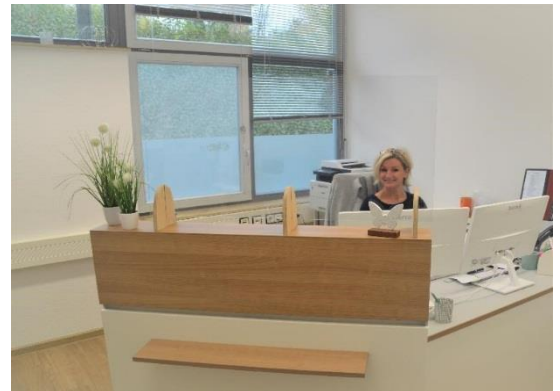
Empfang Therapie- und Fachzentrum.

Im April haben wir begonnen das neue Therapie- und Fachzentrum (vormals Begleitende Dienste) umzubauen. Der erste Teil konnte abgeschlossen werden. Der zweite Teil ist in Arbeit und wird voraussichtlich im Februar 2021 fertig. Hier finden sich dann Therapieräume für alle Fachrichtungen aus unserem Haus. Das Therapie- und Fachzentrum ist mit seiner anerkannten Praxis für Ergotherapie auch für externe Interessenten offen.