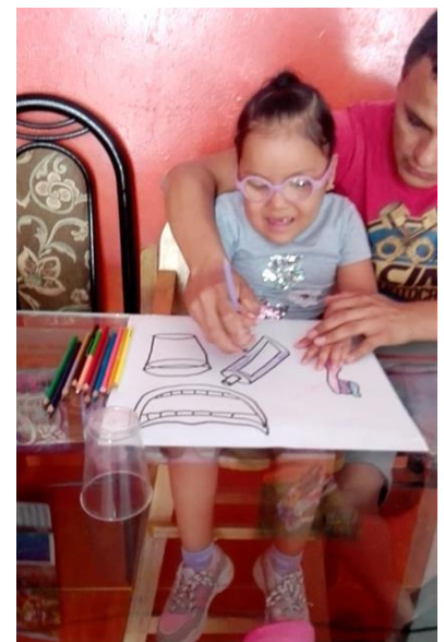
Verschiedene Therapien, wie Ergo- oder Physiotherapie, konnten stattfinden.

Auch die Blindenschule in Cusco war seit März aus Präventivgründen geschlossen. Für die normale Unterhaltung der Einrichtung im Laufe des Jahres haben wir die notwendigen Mittel zur Verfügung gestellt. Die Zeit ohne Schüler*innen wurde in der Schule genutzt, um Renovierungsarbeiten, insbesondere Malerarbeiten, in den Klassen, in Küche und Speisesaal sowie in der Aula durchzuführen. Auch war es wieder nötig, die Dächer zu überprüfen und ggf. zu reparieren, damit es nicht in der Regenzeit, die in Cusco von Oktober bis März sehr heftig ausfallen kann, zu Wassereinbrüchen kommen kann. Auch die Außenwände müssen überprüft und der Verputz ausgebessert werden. Die Wände sind mit sogenannten Adobe-Steinen errichtet. Diese Steine sind aus Lehm geformt und nicht gebrannt. Sie werden selbst hergestellt und nur in der Sonne trocknen gelassen. Wenn Feuchtigkeit eindringt, beginnen sie sich aufzulösen.