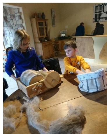
Zuerst muss die Wolle gewaschen und dann gekämmt werden.

Im Anschluss konnten sie zusammen mit ihren Eltern echte Schafswolle spinnen, kämmen, säubern und filzen.