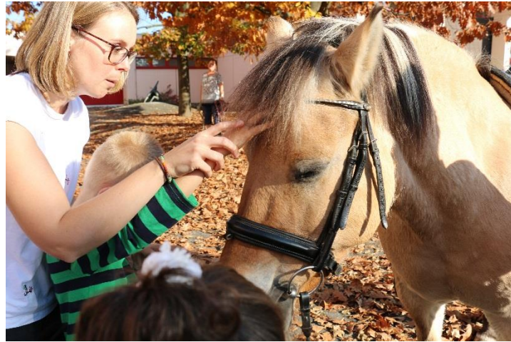
Vorsichtiges Herantasten an die geduldigen Pferde.

Die Entlassschüler*innen wurden im kleinen Rahmen verabschiedet. Einige von ihnen konnten sich über ein besonderes Abschiedsgeschenk freuen. Sie durften ihre vom Verein geliehenen Laptops behalten und mit in ihre neue Einrichtung nehmen.