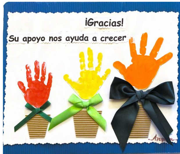
„Danke! Deine Hilfe hilft uns zu wachsen.“

Alle beschriebenen Hilfen waren nur durch Ihre großzügige Unterstützung möglich, liebe Mitglieder, Freunde und Gönner. Ihnen allen sagen wir ein herzliches Dankeschön.