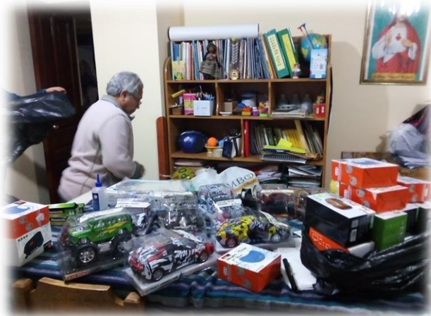
Die Geschenke sind eingekauft, jetzt muss noch alles verpackt werden.

Der Bitte um finanzielle Hilfen für die Weihnachtsgeschenke auch in diesem Jahr sind wir gerne nachgekommen. Dieses Jahr ist es besonders schwierig: Die Lehrer*innen kaufen für ihre Schüler*innen die Geschenke ein, verpacken sie und deponieren sie in der Schule. Die Eltern müssen sie dann dort abholen. Auf den traditionellen Panettone (Hefekuchen) wird in diesem Jahr verzichtet.