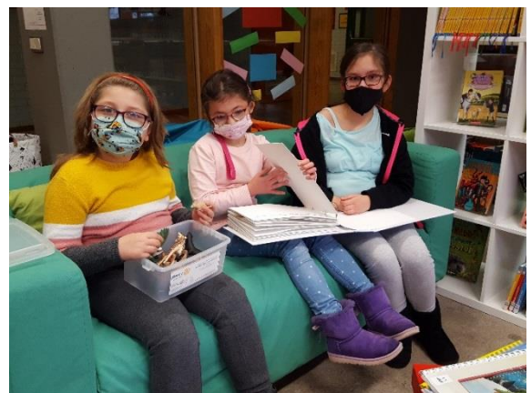
Neue Bücher werden sofort gelesen und ausprobiert.

Die Schülerbibliothek konnte weiter ausgebaut und mit neuem Lesestoff für alle Altersklassen gefüllt werden. Die Kinder und Jugendlichen haben nach wie vor viel Freude beim Lesen der tollen Bücher und lauschen auch mal gerne spannenden Geschichten während der Pausen.