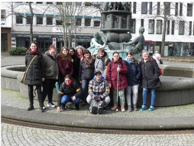
Nach einem erfolgreichen Shoppingtag...

Die Teilnehmerinnen der Mädchen-AG konnten auch in diesem Jahr das beliebte „Mädchenwochenende“ genießen. Neben der üblichen Shoppingtour kam auch die Erholung nicht zu kurz. Die Mädchen genossen einen ausgedehnten Relaxtag in der Therme in Bad Hönningen.